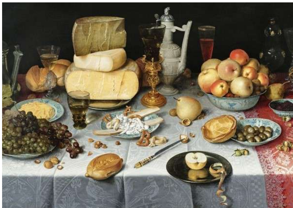
"Still life with cheese" di Floris Claesz van Dijk, c. 1615